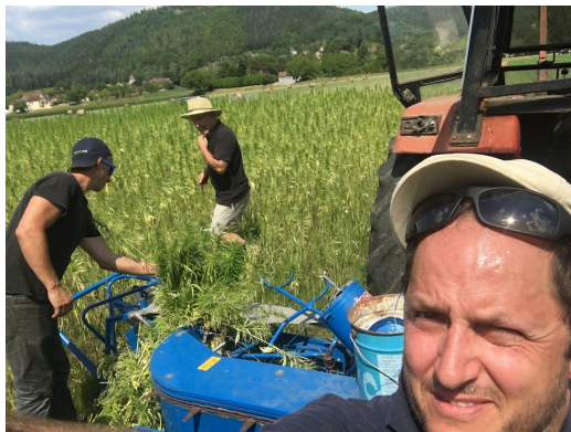
(à gauche: notre récolte 2018, sous la chaleur au pied de St-Cirq Lapopie - 46)

VirgoCoop a fait la démonstration qu'il était possible d'innover et de proposer à nouveau du textile éthique et écologique... avec les acteurs locaux, à l'échelon de nos territoires !